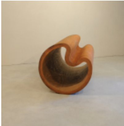
Max Seibald, Butterfly, 2021, Fichte, 145 x 72 cm

Die Abbildungen stehen unter Anführung der Credits für Berichterstattungen honorarfrei zur Verfügung und wurden Ihnen per WeTransfer-Link in der E-Mail zu dieser Presseaussendung übermittelt.