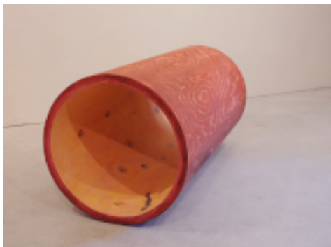
Max Seibald, zeit_raum, 2021, Fichte, Ölfarbe, 115 x 77 x 64 cm | © Max Seibald | Bildrecht, Wien 2021