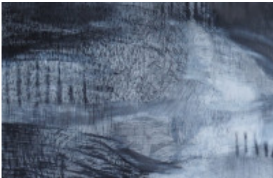
Anna M. Kramm, Forest track, 2021, Graphit, Pastellstift auf Leinwand, 100 x 150 cm | © Anna M. Kramm | Bildrecht, Wien 2021