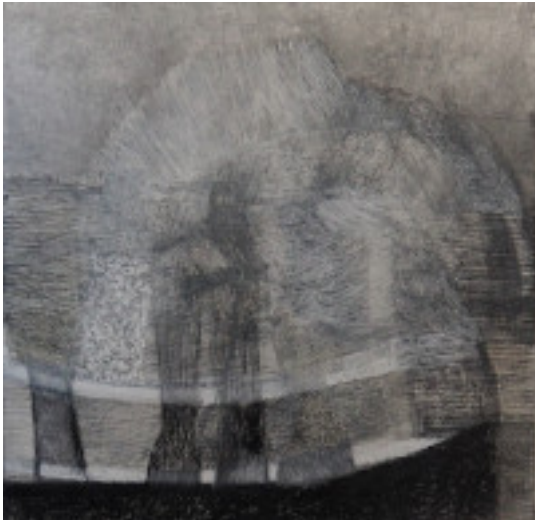
Anna M. Kramm, Black Trail, 2021, Graphit, Ölpastell auf Leinwand, 110 x 110 cm | © Anna M. Kramm | Bildrecht, Wien 2021