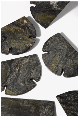
Fotocredit: ANTE UP | TOMB, Tisch aus sechs identischen Steinplatten, 2021 | © Bildrecht, Wien 2024