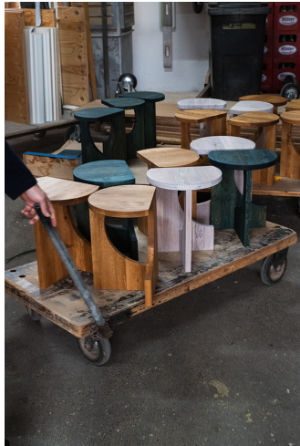
Fotocredit: ANTE UP | OPPONENT, Beistelltisch & Hocker aus Eichenholz, 2022 | Foto: Julian Linden | © Bildrecht, Wien 2024