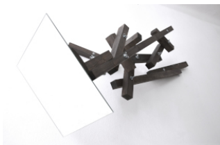
Wendelin Pressl, Beobachtungshilfe, 2012/2022, Holz gebeizt, verschraubt, Spiegel, Maße variabel @ Bildrecht, Wien 2024