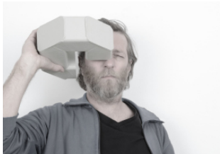
Wendelin Pressl, Der Antikommunikator, 2021, Pappe, Lack, Spiegel, 25 x 9 x 23 cm @ Bildrecht, Wien 2024

Die Abbildungen stehen unter Anführung der Credits für die Berichterstattung honorarfrei zur Verfügung und wurden Ihnen per WeTransfer-Link in der E-Mail zu dieser Presseausendung übermittelt. Weiters sind Presstext und Pressebilder unter https://www.bildrecht.at/presse/ downloadbar.