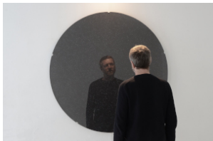
Wendelin Pressl, Das EGOzentrische Weltbild, 2022, Permanentmarker auf Papier, Glas, gerahmt, Lampe, Ø 121 cm @ Bildrecht, Wien 2024